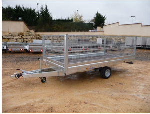
Lateral de reja de 70 cm para TOPLINE 620 y 622