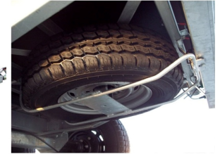
Soporte rueda de repuesto Plataformas TOPLINE 620/622