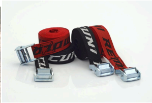
Pack Ahorro 4 Correas para Moto