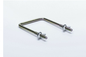
Soporte Forcar Sportman