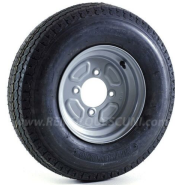
Rueda 5.00x10 4T115 ET0