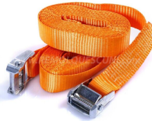
Correas de Moto 4m para Remolque