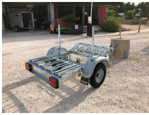
Kit 5 bicis a medida