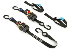
KIT de Correas de Sujeción Moto Remolque Ratchet