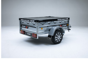
Lona plana para remolque CUNI 150