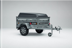
Tapa de PVC para remolque CUNI 150