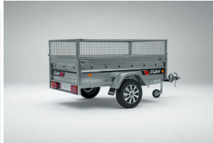
Doble lateral de reja 35cm. para remolque CUNI 150