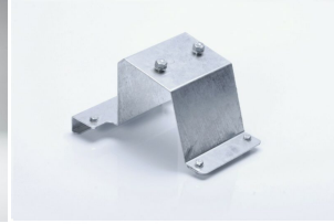
Soporte rueda repuesto Ligeros