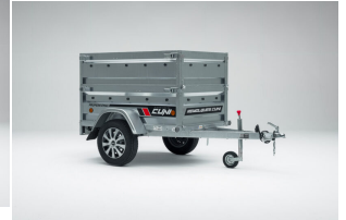
Doble lateral remolque de chapa 39cm. para CUNI 150