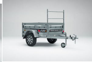
Porta tablonces para CUNI 150