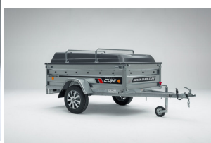
Baca remolque Cuni 150