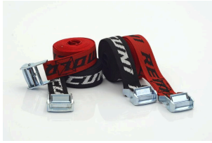
Pack Ahorro 4 Correas para Moto