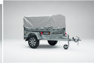
Lona alta con arquillada para remolque de 40cm CUNI 150