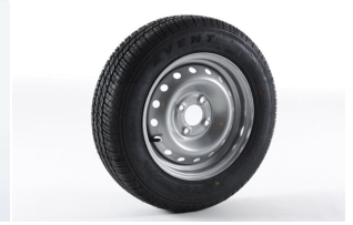
Rueda de Remolque 165/70 R13