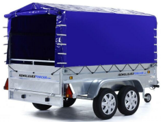
Lona alta con arquillada de 80cm Robust R8