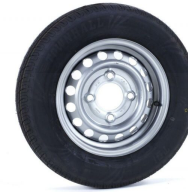
Rueda de Remolque 155/70 R13