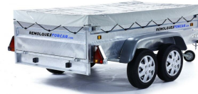
Lona plana para ROBUST R8