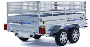
Laterales reja cuadrada 35cm. para ROBUST R4-1500