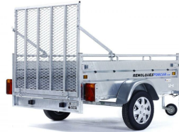
Puerta rampa trasera carga 300 kg + Pies de apoyo