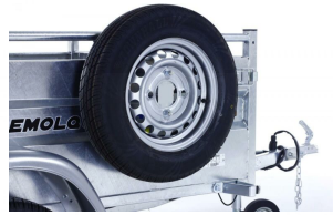
Soporte rueda de repuesto ROBUST 4T130