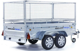
Laterales de reja de 60cm. para ROBUST R8