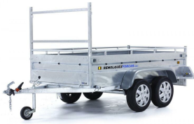
Porta tabloneros para remolques ROBUST R6