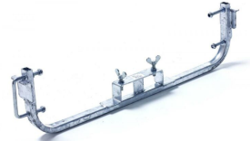
Soporte FORCAR POWER ECO