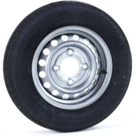
Rueda de Remolque 155/70 Antirrobo para cabezal de R13