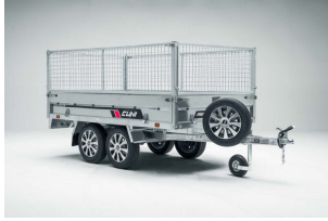
Laterales de reja de 60cm. para POWER BOX-ECO