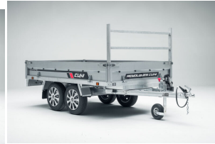
Porta tablonos para remolque POWER BOX ECO