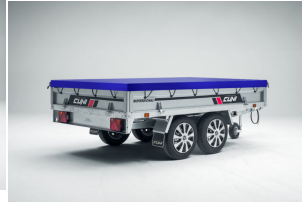
Lona plana para remolque POWER BOX ECO