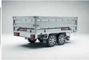
Laterales de chapa de 35cm. para POWER BOX-ECO